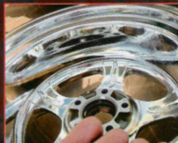
Spiegelglatt werden die Räder bis in die letzte Pore poliert

■ Text Martin Santoro ■ Fotos Hersteller