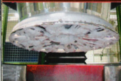
Schaumreinigung nach den eigentlichen Polierarbeiten