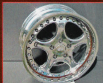
Hochglanzverdichtet sind Räder auch im Winter fahrbar