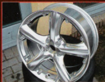
Dreistufiger Poliermarathon mit Keramikkegeln