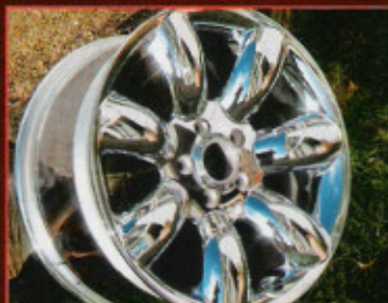
Chromglanz durch moderne Polierverfahren