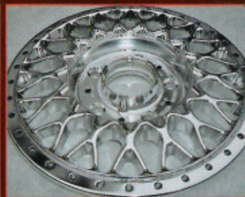
Selbst filigrane Felgensterne lassen sich bearbeiten