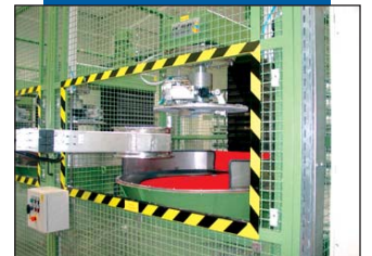
Arbeiten mit modernster Technik