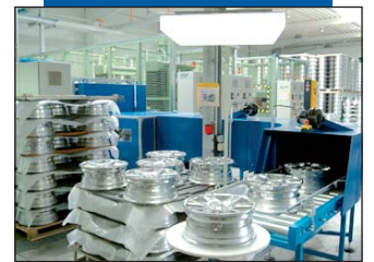
Wasch- und Trockenstraße